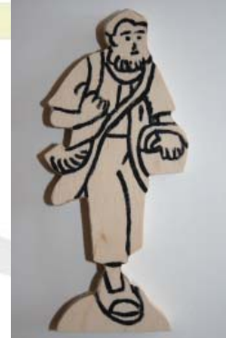
Figur 2.12: Schäfer