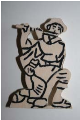
Figur 3.1: Flötenspieler