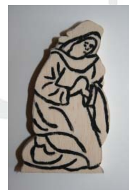
Figur 3.6: Heilige Maria