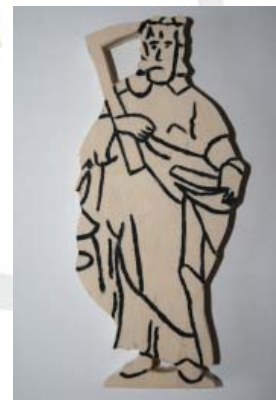
Figur 1.12: Thomas