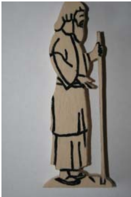
Figur 2.1 Josef