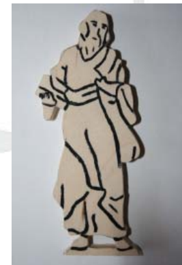
Figur 1.6: Judas Thaddäus