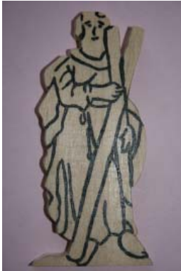
Figur 1.1: Andreas