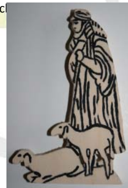
Figur 2.6: Schaf